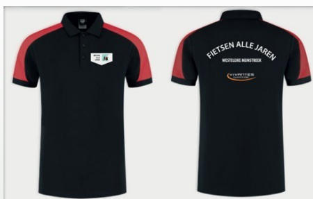
De nieuwe polo's

Tijdens onze Seizoensopening hebben we de mogelijke kleuren gezien en onze keuze laten vallen op zwart-rode polo's en jassen.