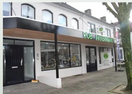
Bikeboutique Rob Akkermans

Inmiddels zijn alle riksja's voorzien van een extra veiligheidsbeugel. Producent Van Raam verkoopt deze als extra optie. Passagiers kunnen zich hieraan vasthouden tijdens de rit. Dit zal een veiliger gevoel geven.