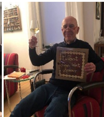
Piloot van het jaar 2022